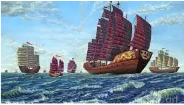
« LE BATEAU TRESOR »